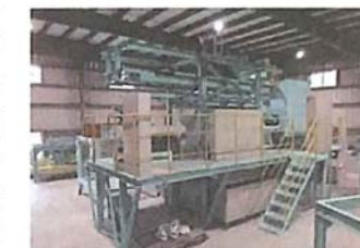
太陽光パネルの完全リサイクル装置

リサイクル事業への参入以来、多様な産業廃棄物に対応した機械を開発してきたが、2013年にテレビ向け液晶、プラズマパネル対応の機械を開発したことを契機に太陽光パネルのリサイクルを発案した。太陽光パネルはガラス部分と発電装置、バックシートの3層構造となっており、同時に破碎すると素材が混在する。このため、アルミ枠の解体から、ガラスとセル等の剥離作業、ガラスの精製までを自動化した「太陽光パネルの完全リサイクル装置」を開発し、ガラス、銀等の有価物や鉛等の有害物質の回収を可能にした。