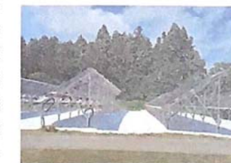
太陽光パネルガラス防草・反射材施工例

ガラスリサイクルは異物を除去したガラスを破碎し粒状にしたうえでガラスの原材料として販売する事業が主体で、リサイクルの対象となるガラスはびんや板ガラス等に限定されていた。同社では、大手ゼネコンや研究機関と共同でアスファルト舗装用の資材化に成功した。また、太陽光パネルガラス等の多用途開発について産業技術総合研究所と、太陽光パネルバックシートの活用について大手非鉄金属メーカーと共同研究を進める等、リサイクル製品の用途を拡大することで廃ガラスリサイクル事業の推進を図っている。